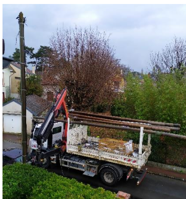
Dépose des poteaux le 4 déc. 2023